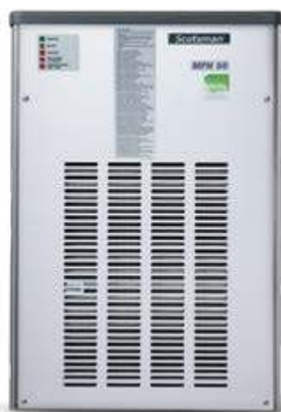
▼ MFN S 56