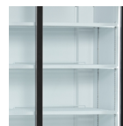
Svislé vnitřní osvětlení